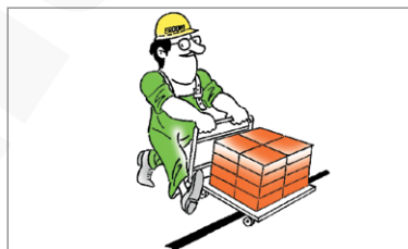
Przewód z osłoną OP ABC