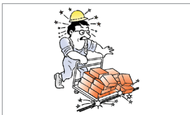
Przewód bez osłony