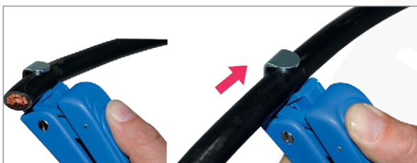
Zdejmowanie izolacji zewnętrznej