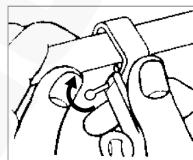
Zmiana kierunku cięcia ostrza przez obrót i przytrzymanie dźwigni „A”