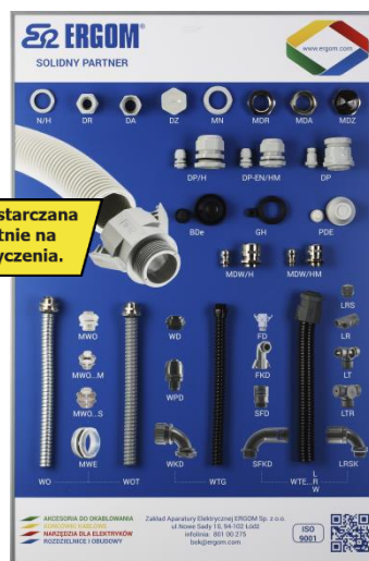
Tablica końcówki kablowe

Tablica dostarczana nieodpłatnie na umowę użyczenia.